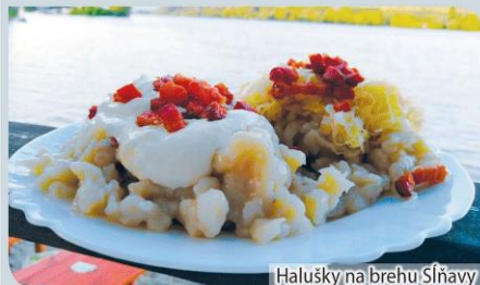
Halušky na brehu Sĺňavy

Letná terasa s výhľadom na hladinu jazera a panorámu Považského Inovca sa nachádza pri Lodenici v Piešťanoch, priamo na cyklotrase okolo Sĺňavy. Zákazníci sa radi zastavia na ze-