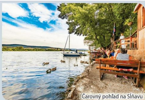
Čarovný pohľad na Sĺňavu